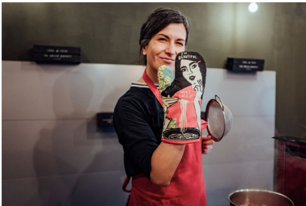
Die Mädels von Dametto Nudeln sind auch am Start!

Und dadurch, dass die teilnehmenden Betriebe quer in der Stadt verteilt liegen, wird eure Tour garantiert eine Entdeckungsreise durchs wunderschöne Hamburg. Unser Geheimtipp: Ihr solltet eure sättigenden Portionen Amore unbedingt für den Fotowettbewerb festhalten. Als Preis gibt es einen Hotelaufenthalt für zwei Personen in Bella Italia abzustauben!